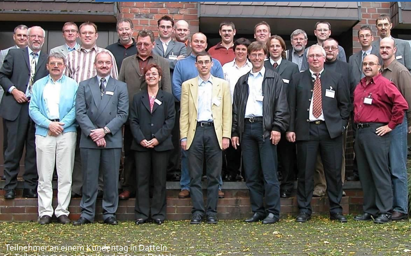
Teilnehmer an einem Kundentag in Datteln

Durch Schülerpraktika, die Gewinnung von Mitarbeitern aus dem Berufskolleg OstVest, die Einrichtung von Testinstallationen des TeBIS®-Systems in Liegenschaften der Stadt und die Partizipation an städtischen Projekten ist eine starke Verbundenheit zwischen dem Unternehmen und der Stadt Datteln sowie dem Umland von Datteln entstanden.